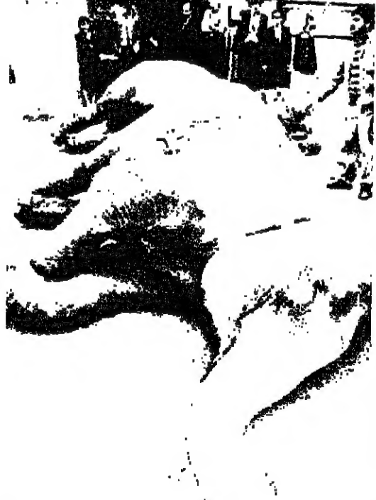
مناصرون في مؤسسة الحياة البرية العالمية احضروا بعض الفيلة ووضعوا امام السفارة اليابانية في فيينا مطالبين الحكومة اليابانية بوقف عن شراء العاج.